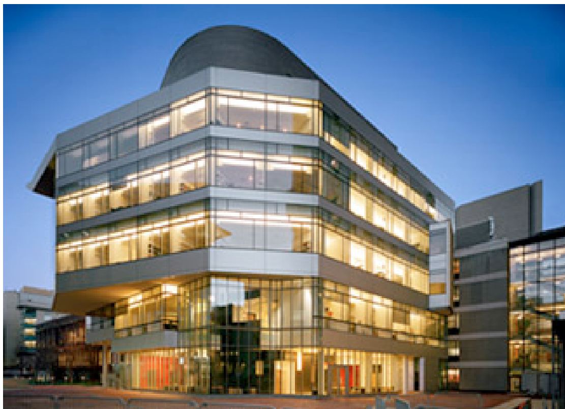
REB: Research and Education Building (会場)

さらに、前回のコース同様に、受講者の皆さん(希望者)によるCase Discussionセッションでは、日本とアメリカの保険制度の違いを越えて、Evidence-Basedの包括的な治療計画について討議します。また治療法のオプションを増やすべく、Free Discussionによって治療計画に関する質疑応答と意見交換を行います。さらに、受講者の皆さんが苦慮しておられる症例などに関しても、受講者と講師陣がフランクに議論できる場が常に用意されています。症例発表は、日本語または英語とし、同時通訳を行います。また、発表スライド作成には、岩手医科大学歯学部の准教授・講師らが、お手伝いサポートいたします。本コースは世界トップレベルの包括的歯科医療を学ぶことのできる 受講者参加型CEコース であり、日本の歯科医療のおおきな発展に寄与することを目的としています。