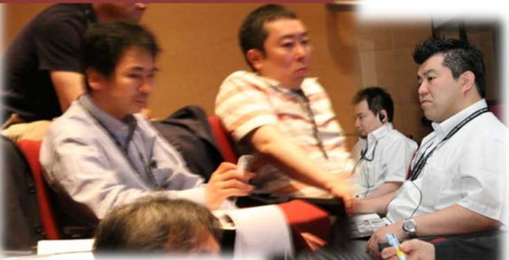
岩手 補綴・インプラント学講座, 教授・講師陣